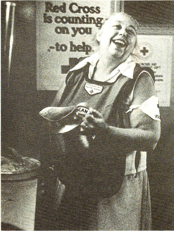
Secondo premio ex equo: «Assistente benevola Croce Rossa davanti a un banco di vendita», Maryland (USA), Croce Rossa americana, Gene Jeffers, agosto 1978.