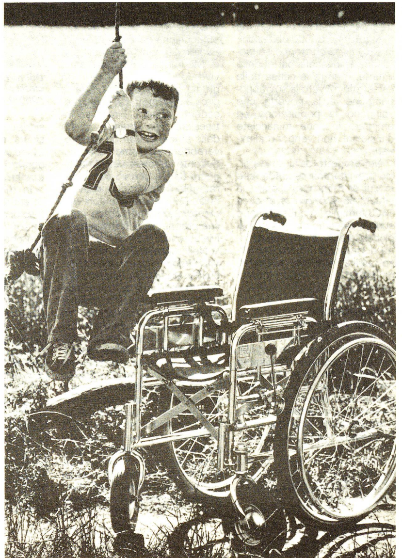
Terzo premio ex equo: «Senza titolo», Croce Rossa danese, Heine Pedesen, 1975.