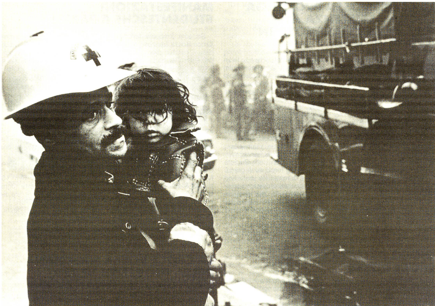
Primo premio: «Un soccorritore conforta una piccola vittima», Croce Rossa americana, Jene Jeffers, novembre 1985.

Concorso fotografico realizzato in occasione della XXV Conferenza internazionale della Croce Rossa e della Mezzaluna Rossa