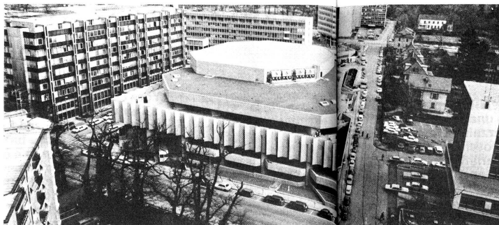
Il Palazzo del CICG dove si svolgerà la Conferenza.

Il CICR, che è il custode ed il garante del diritto internaziona-