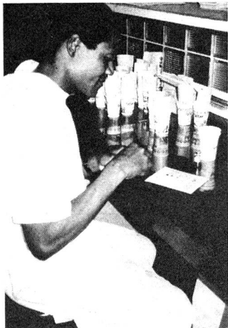
Mozambico Anche dal punto di vista finanziario è estremamente complesso riuscire a trovare una copertura per un determinato progetto.

ci, culturali, religiosi ed ecologici. La loro nozione del tempo, e la loro natura intrinseca si adattano a malapena ai nostri schemi mentali ed ai nostri metri di misura; alla nostra capacità di comprensione. E pertanto il mio compito è quello di costruire ponti fra la istituzione CRS da una parte, ed i villaggi dei contadini Quechua dall'altra: appianare difficoltà nascenti dall'essere le due società così diverse, e far fronte alla mia parte di responsabilità nei confronti di ambedue le parti.