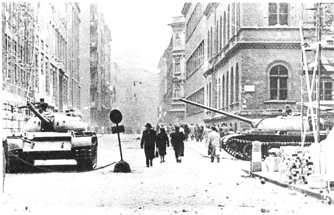
1956: confusione dopo la battaglia. Operai, studenti e truppe ungheresi cercano di respingere l'Armata Rossa.

I marzeks (commercianti indipendenti che lavorano come dei piccoli capitalisti al margine dell'economia comunista del loro Paese) rappresentano una parte importante e riconosciuta dell'economia ungherese, capaci di risolvere tutti i problemi, di fare di tutto. Riparano automobili, costruiscono case, vendono verdure, tagliano i capelli. Si trovano in pressoché tutti i settori della vita, dove i servizi offerti dallo Stato sono troppo lenti, negligenti, o semplicemente incompetenti. La loro rete è così diffusa, che essi hanno creato una loro associazione nazionale, che dirige non meno di 8 centri d'informazione con un'organizzazione telefonica che funziona giorno e notte per coordinare le offerte e le prestazioni di servizi. È negli anni sessanta