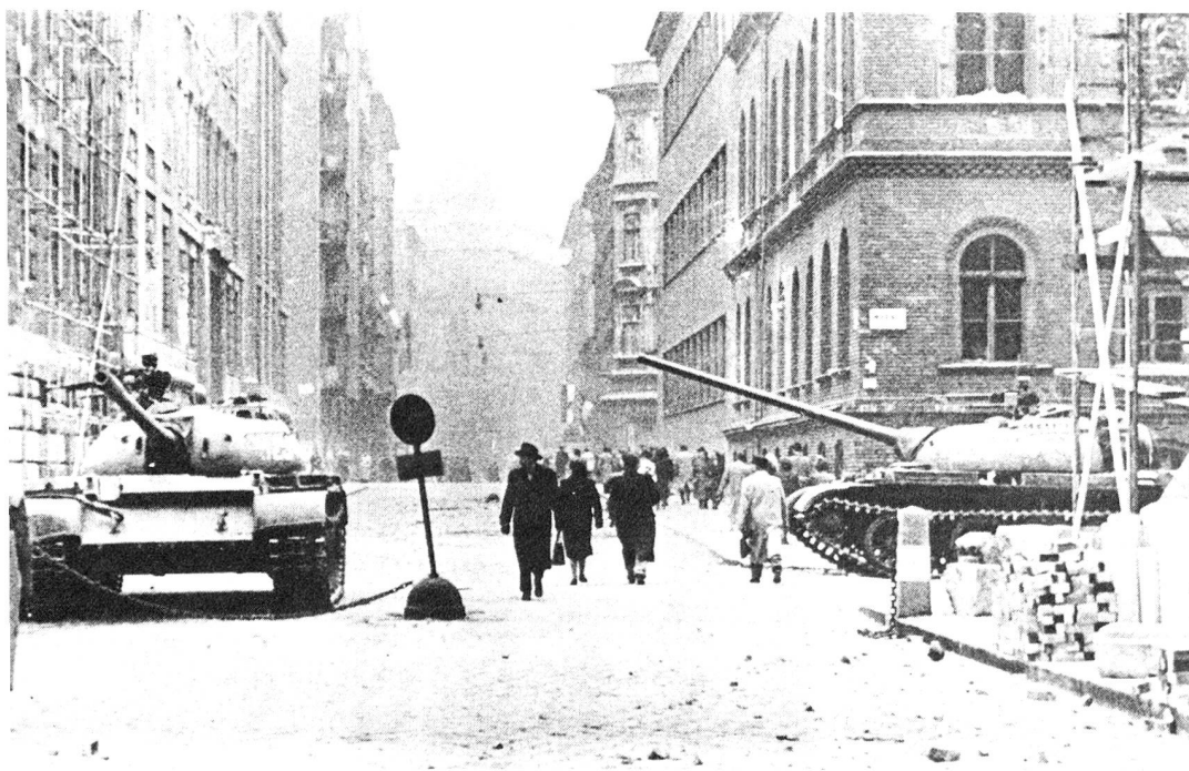
1956: confusione dopo la battaglia. Operai, studenti e truppe ungheresi cercano di respingere l'Armata Rossa.

I marzeks (commercianti indipendenti che lavorano come dei piccoli capitalisti al margine dell'economia comunista del loro Paese) rappresentano una parte importante e riconosciuta dell'economia ungherese, capaci di risolvere tutti i problemi, di fare di tutto. Riparano automobili, costruiscono case, vendono verdure, tagliano i capelli. Si trovano in pressoché tutti i settori della vita, dove i servizi offerti dallo Stato sono troppo lenti, neglienti, o semplicemente incompetenti. La loro rete è così diffusa, che essi hanno creato una loro associazione nazionale, che dirige non meno di 8 centri d'informazione con un'organizzazione telefonica che funziona giorno e notte per coordinare le offerte e le prestazioni di servizi. È negli anni sessanta