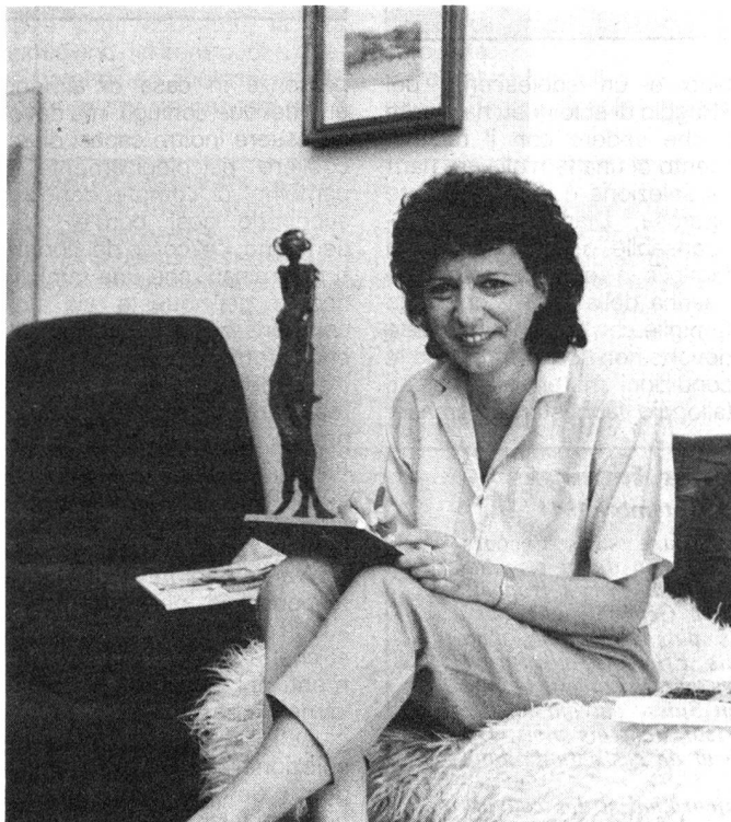
Sylva Nova: il sorriso del sud...