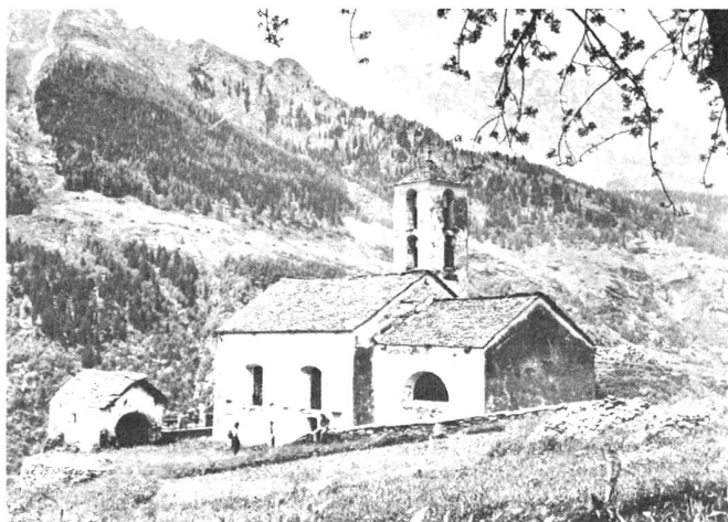
Nelle vicinanze di Braggio.