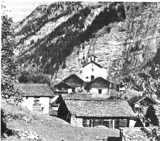
Il villaggio di Masciadone.