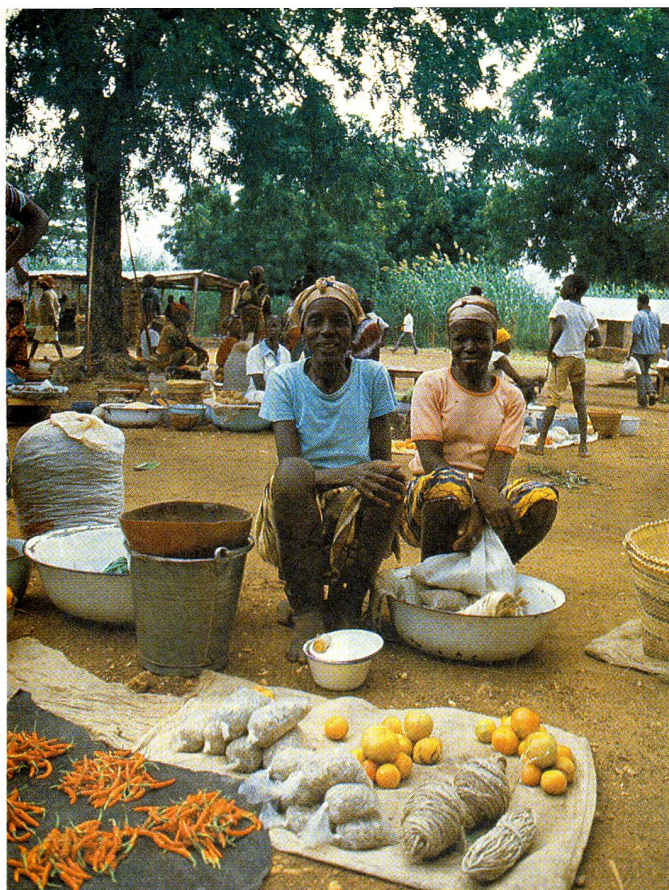
Il mercato di Zebilla dove si può trovare miglio, ortaggi, pomodori, pepe rosso e okros.