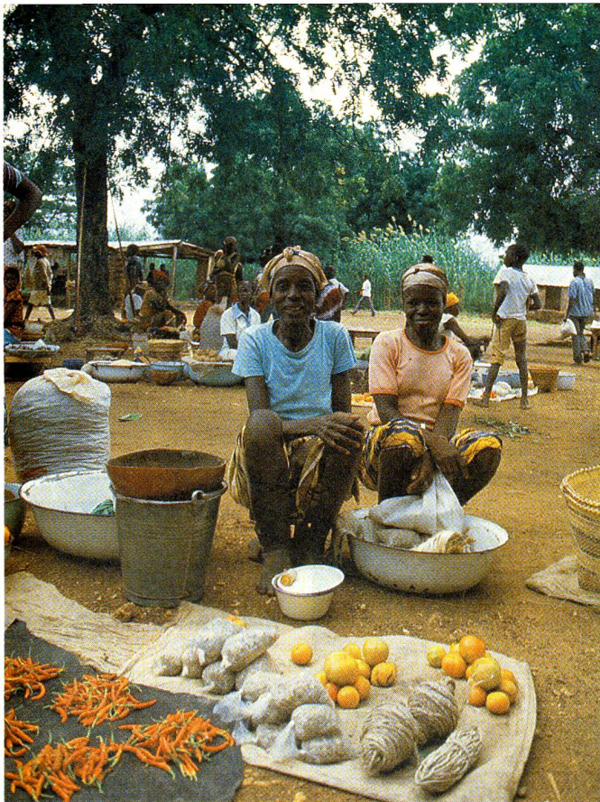
Il mercato di Zebilla dove si può trovare miglio, ortaggi, pomodori, pepe rosso e okros.