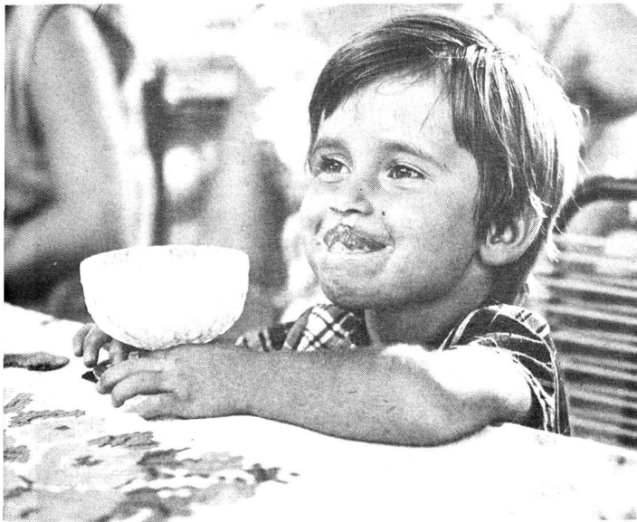
Due mondi per un'unica infanzia.