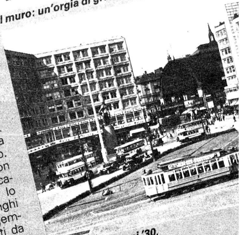
Modernismo anni '30.

Berlino è un'isola, l'Europa un continente alla deriva e la storia del mondo occidentale si ferma qui, in mezzo a questo disordinato e splendido modo di conciarsi. Drogati, ubriachi, l'espressione assente, molti hanno i lobi delle orecchie perforati da qualche spillo da balla. In testa, alta trenta centimetri, con le sue tonalità viola e arancione smagliante, la cresta punk assume un'aria barocca. La ricetta: un po' di acqua zuccherata, birra e uova. Infagottate nelle loro uniformi color beige, le vecchiette restano meravigliosamente impassibili. È tutta loro la storia del passato che via via ritorna alla memoria: