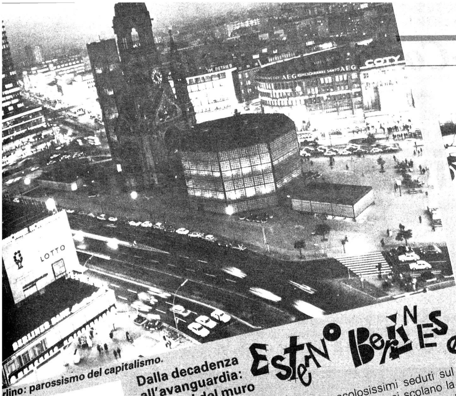
Berlino: parossismo del capitalismo.