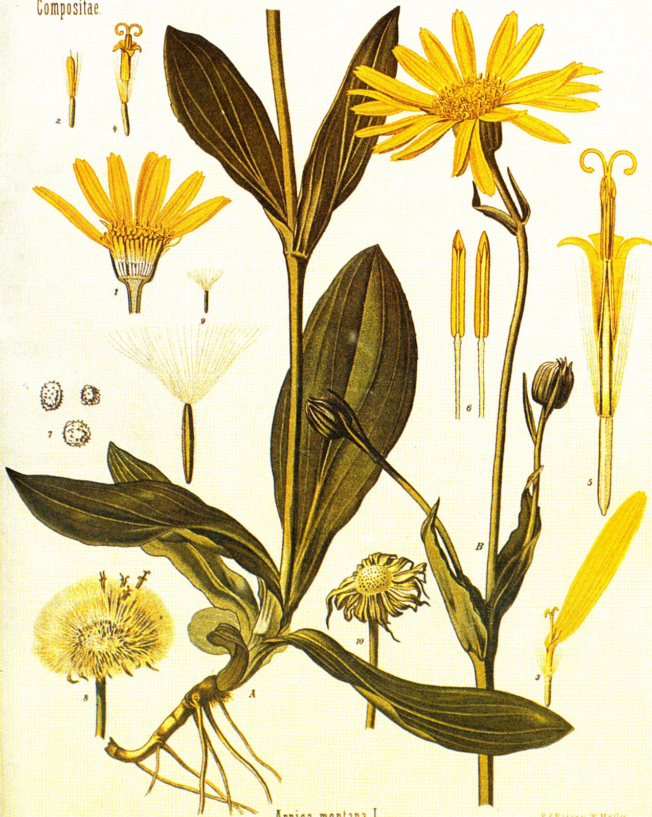
Arnica montana L.