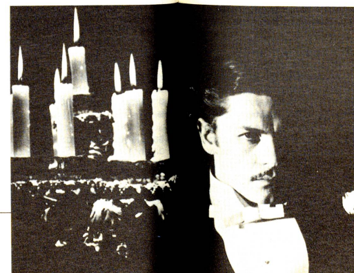
Per secoli e secoli l'uomo di scienza ha cercato di capire il preciso ruolo del sangue alla luce delle candele.

Michel Servet, medico spagnolo che, perseguitato dall'inquisizione, riparò a Ginevra (1509-1553), scoprì che la circolazione polmonare permette al sangue venoso di purificarsi e di ossigenarsi nei polmoni.