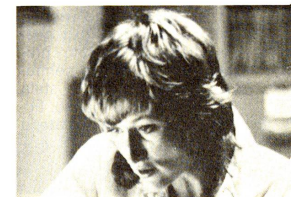
Dalle candele al computer abbiamo perso il senso della fantasia e una certa poesia, ma il santo vale la candela...!

Per rispondere a questa domanda cruciale e per finalmente capire l'insieme delle funzio-