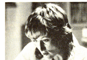
Dalle candele al computer abbiamo perso il senso della fantasia e una certa poesia, ma il santo vale la candela...!

Per rispondere a questa domanda cruciale e per finalmente capire l'insieme delle funzio-