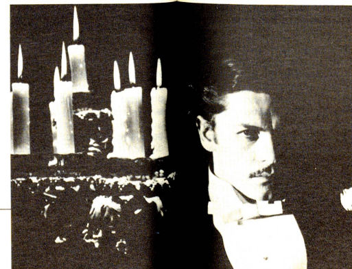
Per secoli e secoli l'uomo di scienza ha cercato di capire il preciso ruolo del sangue alla luce delle candele.

Michel Servet, medico spagnolo che, perseguitato dall'inquisizione, riparò a Ginevra (1509-1553), scoprì che la circolazione polmonare permette al sangue venoso di purificarsi e di ossigenarsi nei polmoni.