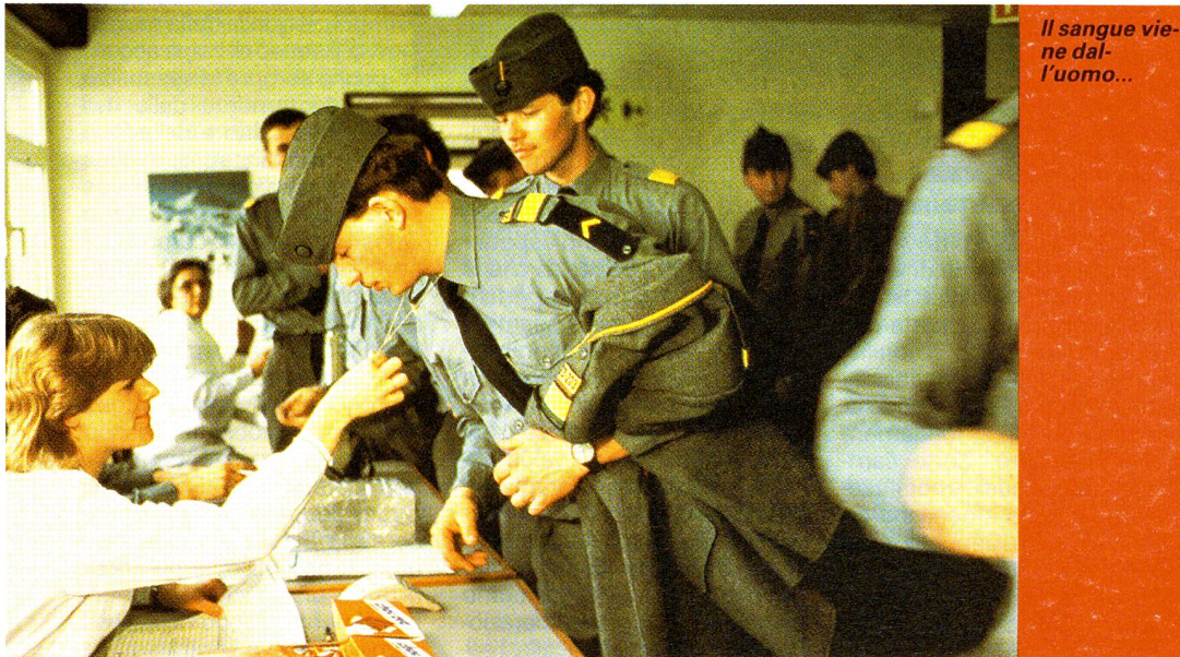
Il sangue viene dall'uomo...

I progressi della scienza del sangue o ematologia, sono legati alle lotte contro malattie il cui solo nome ci angoscia: per esempio, la leucemia o la malattia di Hodgkin. La cattiva conoscenza del loro ambiente di contagio ne rendeva difficile la cura. «Per molto tempo il sangue è stato considerato dai medici organo liquido. La sua composizione era ignorata.» La leucemia è la malattia del