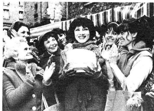
La presenza dell'aiuto domiciliare è sempre apprezzata.

Coloro che prestano l'aiuto domiciliare sono professionisti preparati attraverso i corsi delle scuole cantonali di formazione per operatori sociali di Sorengo e di Giubiasco. Essi sono capaci d'infondere sicurezza nelle situazioni più svariate. Sono legati dal segreto professionale e collaborano con altri operatori sociali nel campo medico-sociale. □