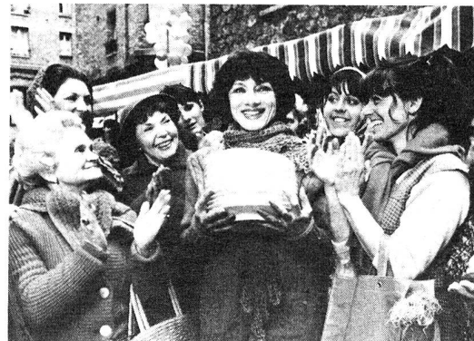
La presenza dell'aiuto domiciliare è sempre apprezzata.

ne di determinati lavori a istituzioni che a loro volta ricorrono alle risorse e alle capacità degli handicappati, consentendo loro una certa autonomia. Oppure avvicinando i responsabili dei numerosi gruppi che incoraggiano lo sport per handicappati, assistere alle loro gare e assegnare eventuali premi ai partecipanti. Invito pure le persone in buona salute a rendere semplicemente visita agli ammalati e ai pazienti cronici curati a domicilio o all'ospedale, al fine di interrompere il loro isolamento, di ascoltarli e di dimostrare a ciascuno di loro che la sorte che li accomuna non ci lascia indifferenti e che noi ammiriamo e incoraggiamo gli sforzi che essi fanno per accettare la loro condizione e i tentativi per reinserirsi nella vita di ogni giorno.» □