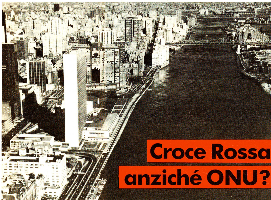
Il palazzo dell'ONU a New York: «small is beautiful».