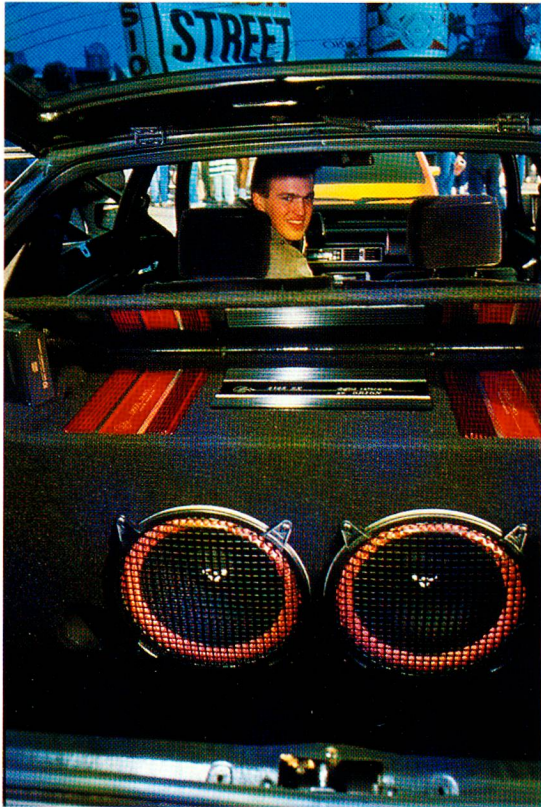
JIM ARONOVSKI, PICTURE GROUP