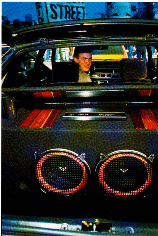
JIM ARONOVSKI, PICTURE GROUP