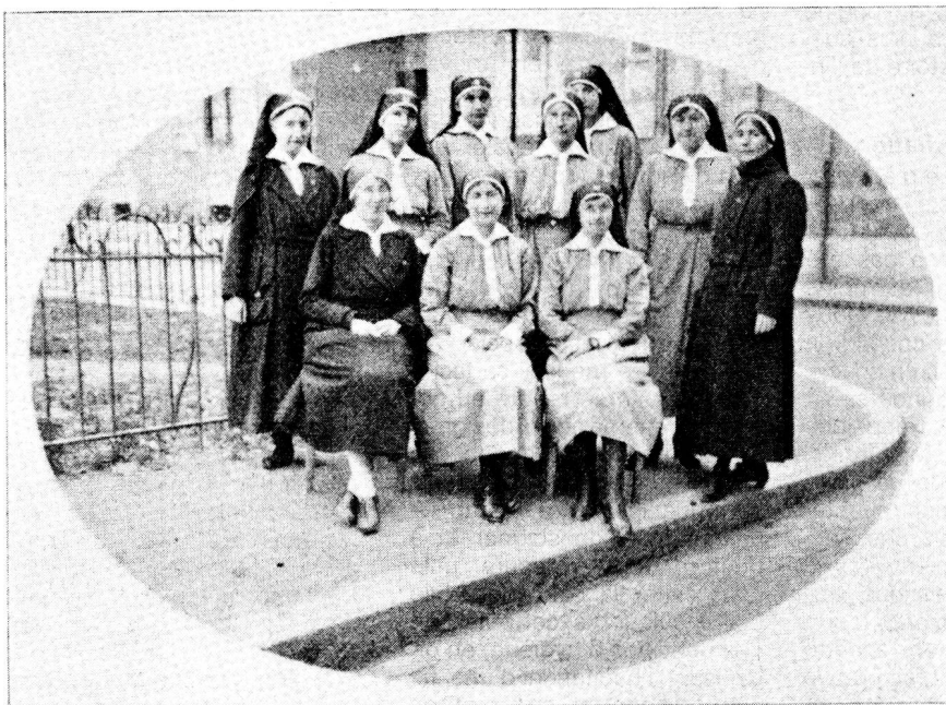
Infirmières visiteuses titulaires et auxiliaires du Dispensaire d'hygiène sociale de la Croix-Rouge genevoise. (Revue la Croix-Rouge suisse 1922, N° 8.)

En ce qui concerne la formation des infirmières, nous sommes contraints, par l'espace limité de ces colonnes, de renvoyer le lecteur à d'autres textes (par exemple «La professionnalisation des soins in-