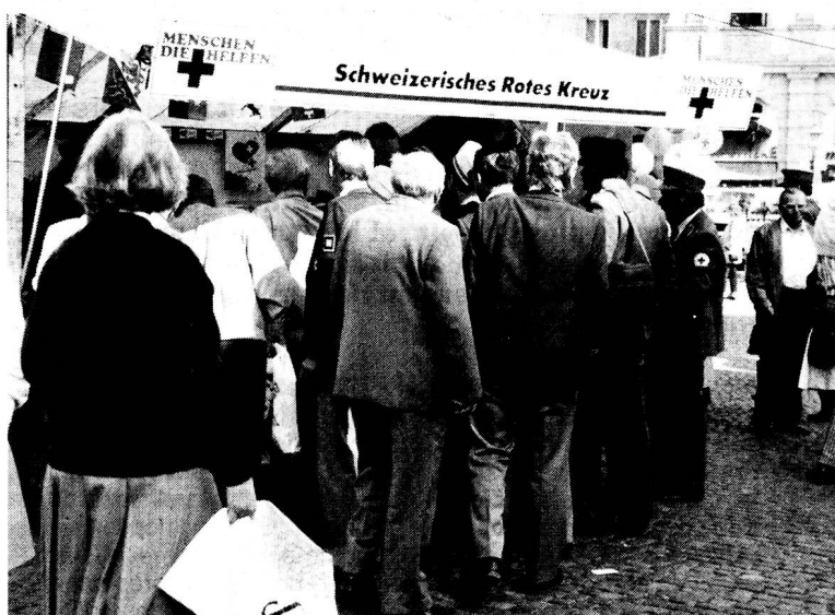
Augsbourg, lieu de rencontres pour les sociétés nationales Croix-Rouge germanophones.

Mais le véritable but de ces manifestations n'est pas, ou du moins pas seulement, d'éveiller l'intérêt de la population d'Augsbourg pour la Croix-Rouge. Le véritable prétexte de tout cela, c'est une émission télévisée diffusée en Eurovision par les chaînes allemande, autrichienne et suisse alémanique. Un show télévisé en forme d'émission de variétés, savamment orchestré et dosant subtilement la chansonnette avec les activités de la Croix-Rouge. Celles surtout qui sont les plus spectaculaires: les opérations de sauvetage et de secours d'urgence, agrémentées de témoignages émouvants de rescapés sauvés grâce à la Croix-Rouge. Une émission qui sans doute fera beaucoup pour la notoriété de notre Mouvement et qui a le mérite de réunir trois pays. Un regret tout de même, comme toujours dans les médias: le côté spectaculaire des activités de la Croix-Rouge prend le dessus. Il faut accrocher le client, c'est-à-dire le téléspectateur, trop vite enclin à «zapper» dès que son attention baisse. Mais cela, ce sont les lois des médias actuels et nous ne pouvons pas les changer... □