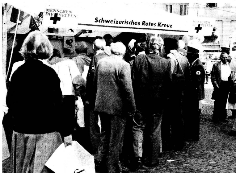
Augsbourg, lieu de rencontres pour les sociétés nationales Croix-Rouge germanophones.

Mais le véritable but de ces manifestations n'est pas, ou du moins pas seulement, d'éveiller l'intérêt de la population d'Augsbourg pour la Croix-Rouge. Le véritable prétexte de tout cela, c'est une émission télévisée diffusée en Eurovision par les chaînes allemande, autrichienne et suisse alémanique. Un show télévisé en forme d'émission de variétés, savamment orchestré et dosant subtilement la chansonnette avec les activités de la Croix-Rouge. Celles surtout qui sont les plus spectaculaires: les opérations de sauvetage et de secours d'urgence, agrémentées de témoignages émouvants de rescapés sauvés grâce à la Croix-Rouge. Une émission qui sans doute fera beaucoup pour la notoriété de notre Mouvement et qui a le mérite de réunir trois pays. Un regret tout de même, comme toujours dans les médias: le côté spectaculaire des activités de la Croix-Rouge prend le dessus. Il faut accrocher le client, c'est-à-dire le téléspectateur, trop vite enclin à «zapper» dès que son attention baisse. Mais cela, ce sont les lois des médias actuels et nous ne pouvons pas les changer... □