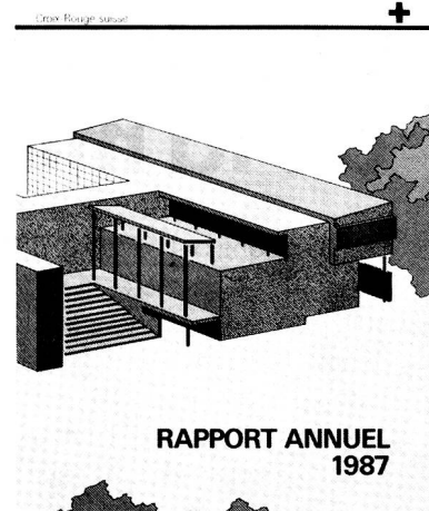
RAPPORT ANNUEL 1987

l'aide de la CRS (45 en 1986) et 47 délégués ont été envoyés sur le terrain (50 l'année précédente) soit pour organiser les secours d'urgence, soit pour effectuer un travail de construction, l'assistance médicale, le développement de centres de transfusion et le renforcement de Sociétés nationales de la Croix-Rouge; 8 pays touchés par des catastrophes ont bénéficié de secours d'urgence.