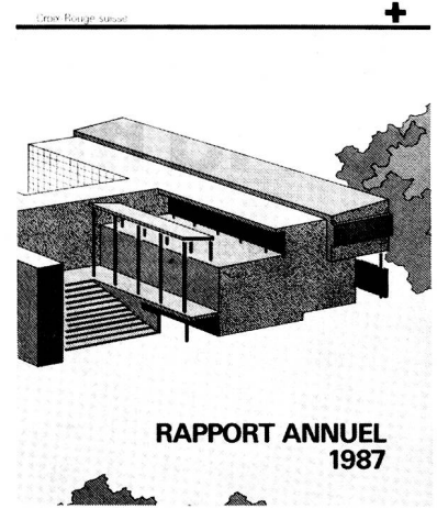
RAPPORT ANNUEL 1987

l'aide de la CRS (45 en 1986) et 47 délégués ont été envoyés sur le terrain (50 l'année précédente) soit pour organiser les secours d'urgence, soit pour effectuer un travail de construction, l'assistance médicale, le développement de centres de transfusion et le renforcement de Sociétés nationales de la Croix-Rouge; 8 pays touchés par des catastrophes ont bénéficié de secours d'urgence.