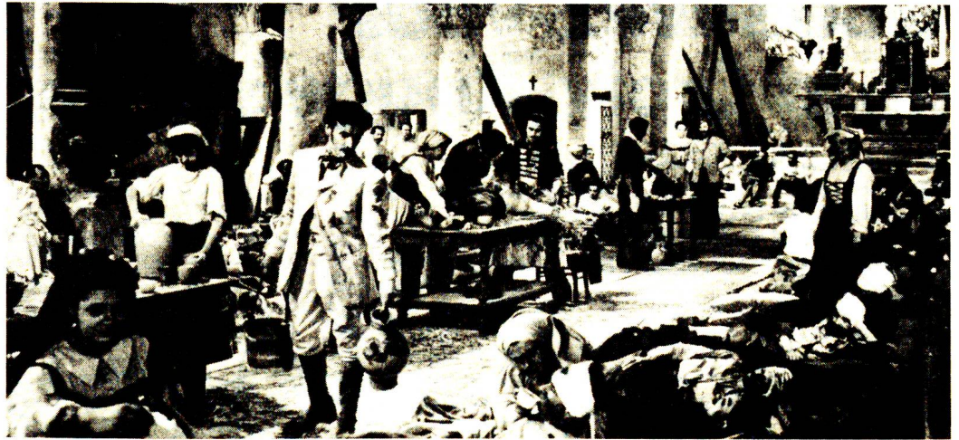
Dans l'église de Castiglione, Henry Dunant, avec l'aide des habitants du lieu, improvise une action de secours en faveur des mourants et des blessés. Photo extraite du film «D'homme à homme», de Christian Jacque (1948).

Les quatre membres de la Commission devinrent rapide-