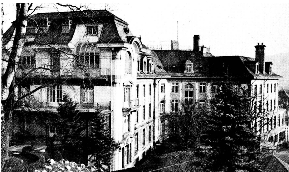
L'ancien bâtiment du Lindenhof, première école d'infirmières de la Croix-Rouge suisse.

fin, Heer ambitionne un statut social assez élevé, pour que leur action de réforme sanitaire au sein de la société soit prise au sérieux. C'est dans ce but, justement, qu'en 1901 s'ouvre à Zurich la «Pflegi».