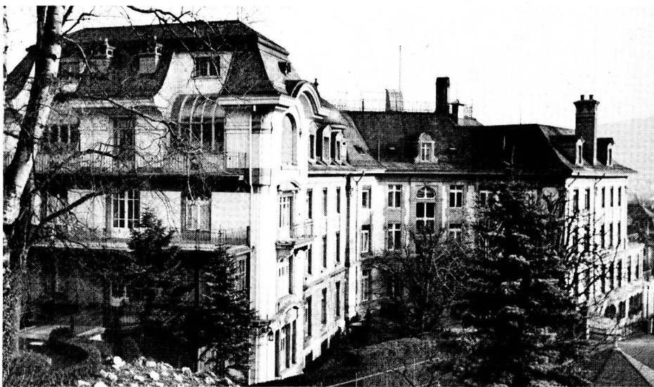
L'ancien bâtiment du Lindenhof, première école d'infirmières de la Croix-Rouge suisse.

fin, Heer ambitionne un statut social assez élevé, pour que leur action de réforme sanitaire au sein de la société soit prise au sérieux. C'est dans ce but, justement, qu'en 1901 s'ouvre à Zurich la «Pfliegi».