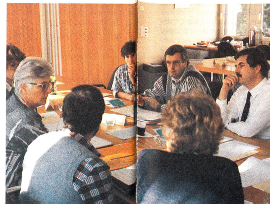
«Je trouve que...»: Le travail de groupe permet le dialogue et l'échange de points de vue.

Les journées consacrées à cet objectif ne sont pas seulement l'occasion d'un échange d'informations entre secrétariat central et sections, mais permettent aussi aux différents collaborateurs de parler de leurs expériences. Afin d'encourager une telle démarche, plusieurs réunions au-