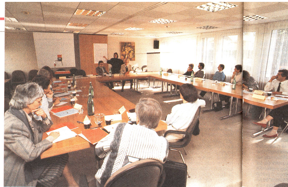
L'éventail des cours CRS en 1988

En sa qualité d'organisation humanitaire sans but lucratif, la Croix-Rouge suisse poursuit deux objectifs dans son projet de perfectionnement professionnel. Premièrement, elle tient à améliorer ses prestations de service sur le plan qualitatif et quantitatif, en complétant ou en diversifiant la formation de ses collaborateurs. Deuxièmement, elle cherche à encourager les discussions sur les problèmes personnels et les difficultés de communication, afin d'y remédier à l'aide de solutions adaptées décidées en commun