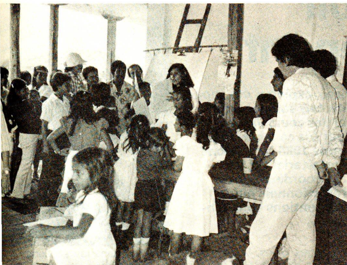
Les cours organisés avec le soutien de la Croix-Rouge suisse sont avant tout l'occasion pour les mères et leurs enfants de se rencontrer et de reprendre courage.

mentation riche, contribuent à l'amélioration du sol, fournissent du bois à brûler et évitent un dessèchement trop rapide du sol lors des périodes de sécheresse.