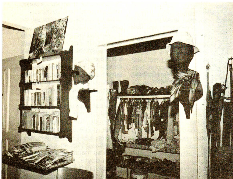
Le vestiaire: une caverne d'Ali Baba qui ne cesse de s'enrichir.

Ce dernier a recours à 35 auxiliaires de santé qui se rendent chez les malades pour des soins de base. Ceux et celles qui suivent le cours approprié obtiennent un certificat reconnu dans toute la Suisse. «Mais ce n'est pas une profes-