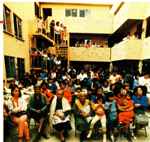
La reconstruction est finie. C'est l'heure de la «Fiesta». Ces derniers semaines, on inaugure, à Mexico, de nombreuses «vecindades» reconstruites par la Croix-Rouge suisse.

La Croix-Rouge suisse a remis aux habitants la propriété de ces appartements. Cependant il ne s'agit pas de simples cadeaux. Les «nouveaux propriétaires ont l'obligation d'alimenter un fonds de solidarité, destiné à l'entretien des maisons, à l'éventuelle construction d'autres habitations ainsi qu'à la mise sur pied d'une infrastructure communautaire selon les vœux