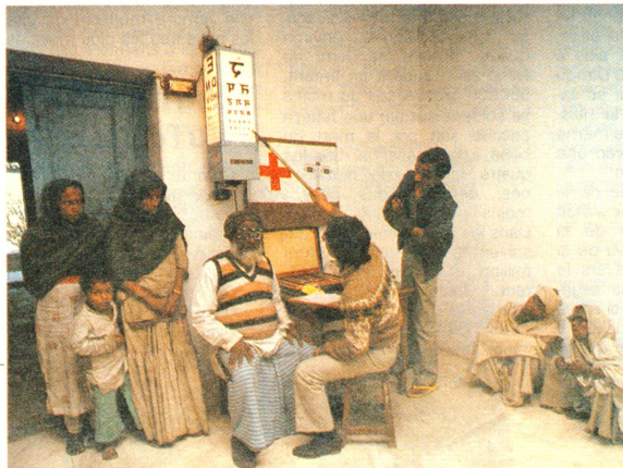
Vue de la salle de consultation de l'hôpital de Népalganj.

Le projet de la CRS au Népal est financé en grande partie par le produit de la campagne de récupération de l'or dentaire, le reste par la Confédération. L'action vieille or, qui a démarré en 1977 déjà, est due à l'initiative d'un médecin-dentiste de Weinfelden (TG), le Dr Schatzmann, qui est aujourd'hui retraité (voir «Actio» 4/87). Les patients contraints de remplacer une couronne en or peuvent faire parvenir les déchets à la CRS au moyen d'une enveloppe jaune spécialement prévue à cet effet et disponible dans la plupart des cabinets de dentaires. Au cours de la seule année 1985, la CRS a collecté de cette manière 13,6 kg de vieux or, pour une valeur de quelque 220 000 francs. Le succès de cette collecte ne s'est pas démenti tout au long des ans, surtout en Suisse alémanique. La poursuite du projet de médecine ophtalmologique dépend toutefois du soutien des donateurs, en l'occurrence des médecins-dentistes qui attirent l'attention de leurs patients sur la possibilité de faire un don.