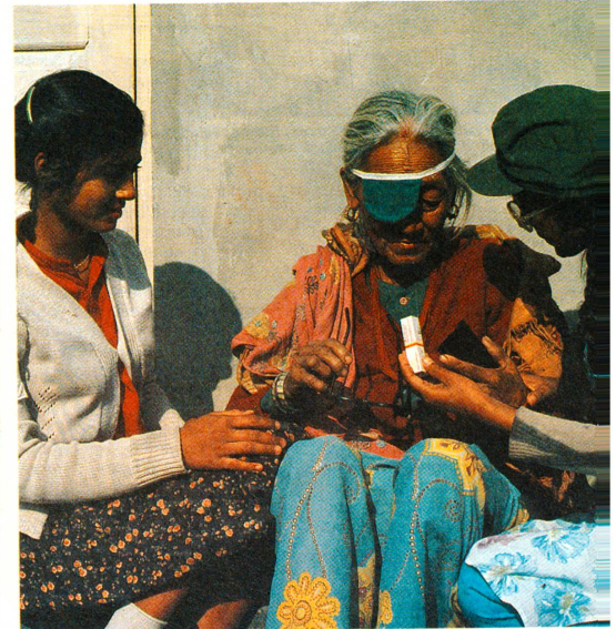
Patiente en convalescence. L'assistance des convalescents est assurée par des bénévoles de la Croix-Rouge suisse népalaise, qui veillent également à ce que les opérés suivent leur traitement post-opératoire.

Le projet de la CRS au Népal est financé en grande partie par le produit de la campagne de récupération de l'or dentaire, le reste par la Confédération. L'action vieille or, qui a démarré en 1977 déjà, est due à l'initiative d'un médecin-dentiste de Weinfelden (TG), le Dr Schatzmann, qui est aujourd'hui retraité (voir «Actio» 4/87). Les patients contraints à la CRS au moyen d'une enveloppe jaune spécialement conçue à cet effet et disponible dans la plupart des cabinets de dentistes, au cours de la seule année 1985, la CRS a collecté de quelque 220 000 francs. Le succès de cette collecte ne s'est pas démenti tout au long des ans, surtout en Suisse alémanique. La poursuite du projet de médecine ophtalmologique dépend toutefois du soutien des donateurs, en l'occurrence des dentistes qui attirent l'attention de leurs patients sur la possibilité de faire un don.