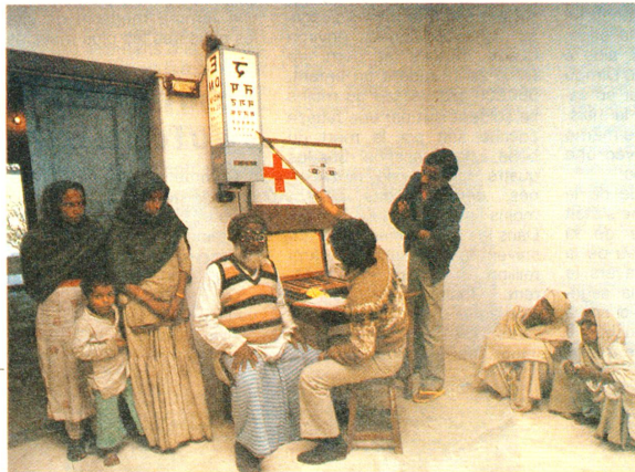
Vue de la salle de consultation de l'hôpital de Népalganj.