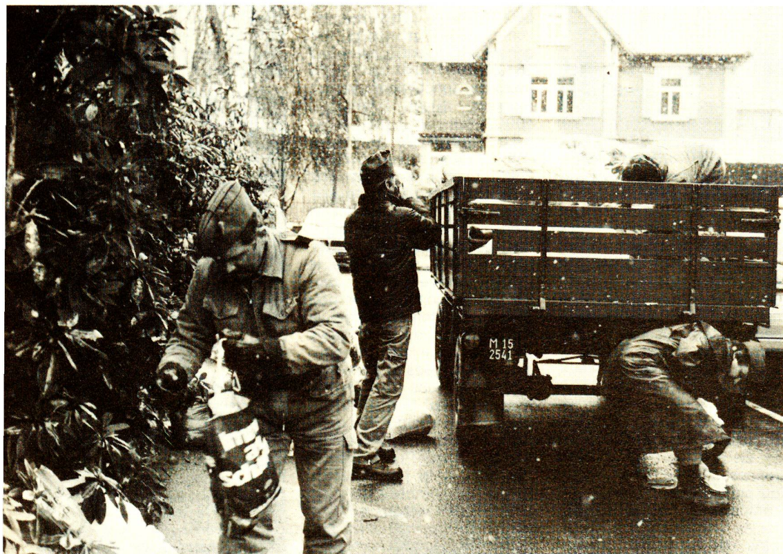
Quelque 300 000 kg de vêtements usagés sont recueillis chaque année lors de la traditionnelle collecte de la section.

La section d'Aarau, qui regroupe les districts d'Aarau, de Brugg, de Kulm, de Lenzburg et de Zofingen, a cependant ajouté de nouvelles prestations à l'éventail des services traditionnels. Le système d'appel d'urgence «Eri-care» est particulièrement important pour les personnes âgées ou malades car il leur permet, lors d'un malaise ou d'une chute, d'avertir une centrale 24 heures sur 24 par simple pression sur un petit dispositif porté au poignet. La section loue ces appareils à