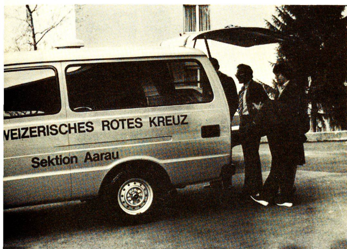
La section d'Aarau a fait l'acquisition d'une ambulance pour assurer le transport des patients alités. Ce véhicule n'assure toutefois aucun transport d'urgence.