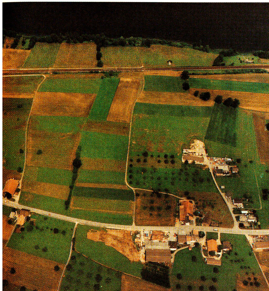
Vue aérienne de l'emplacement du futur centre de formation de la CRS. L'accès du centre sera facilité par la proximité de la voie ferrée et de la gare de Nottwil, qui sera reconstruite. La pose de la première pierre devrait avoir lieu en mai 1987. A l'arrière-plan, on reconnaît le Lac de Sempach.