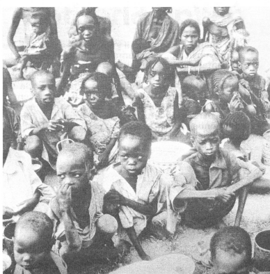
Tchad Un service de soins de santé primaires est en cours de réalisation dans la préfecture de Biltine. Etant engagée à long terme, la Croix-Rouge suisse collabore activement avec les responsables autochtones.