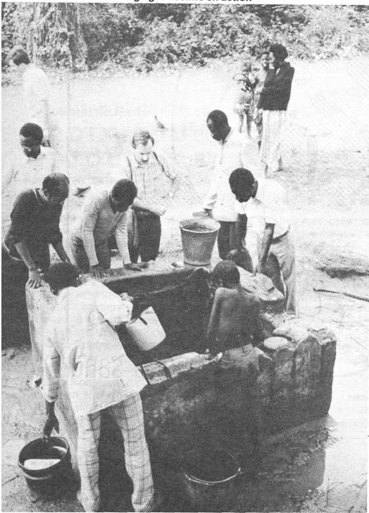
Ghana: la Croix-Rouge ghanéenne en action