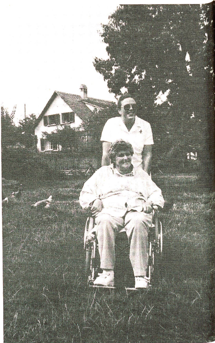
Les auxiliaires de santé de la Croix-Rouge sont devenues des figures familières des deux districts de Morges et Aubonne. Elles prodiguent ce que l'on appelle les soins d'hygiène et de confort, les soins infirmiers proprement dits étant assurés par les infirmières de la santé publique. En 1985, les auxiliaires de santé ont donné plus de 6000 heures de soins.

L'avenir, la section de Morges-Aubonne l'envisage avec lucidité et optimisme. Partout, dans tous les services, des perspectives nouvelles apparaissent. Le secrétariat envisage l'informatisation. Le service des cours lorgne du côté des entreprises. A quand des cours de santé répondant aux besoins