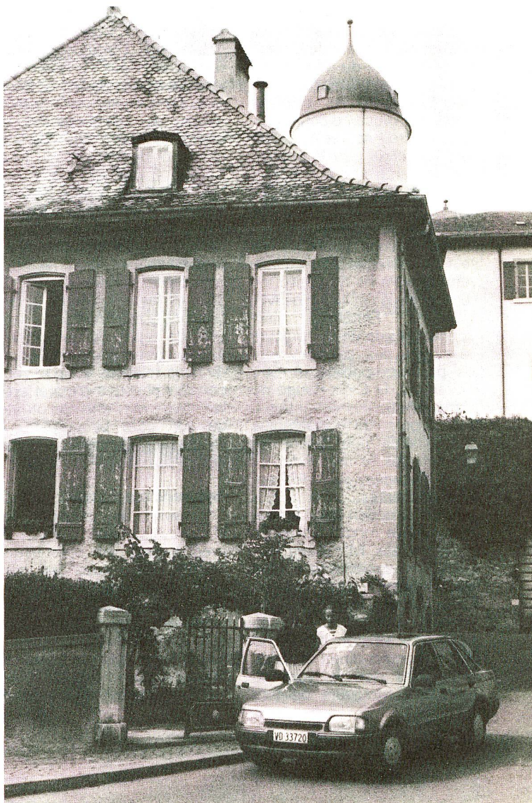
Le service des chauffeurs bénévoles est très actif à Aubonne. La section recherche toujours de nouveaux volontaires pour ce service.