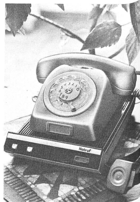
Le système Ericare est raccordé au réseau des PTT et peut fonctionner dans l'ensemble du pays.

Une simple pression du doigt suffit pour appeler la centrale d'alarme.