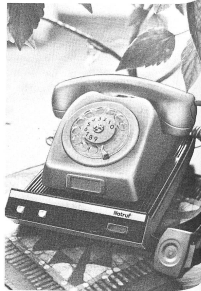
Le système Ericare est raccordé au réseau des PTT et peut fonctionner dans l'ensemble du pays.

Une simple pression du doigt suffit pour appeler la centrale d'alarme.