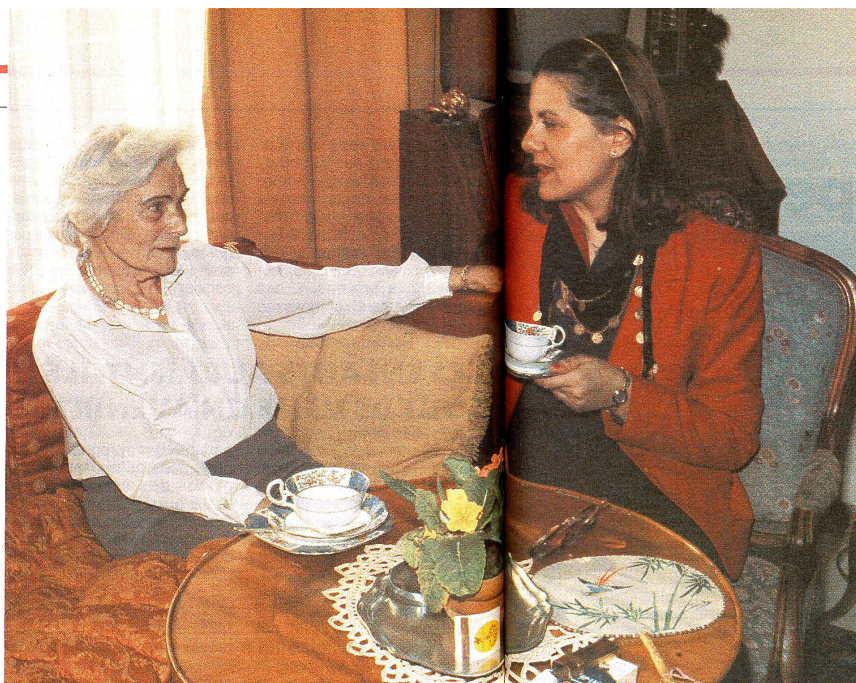
Une invention géniale