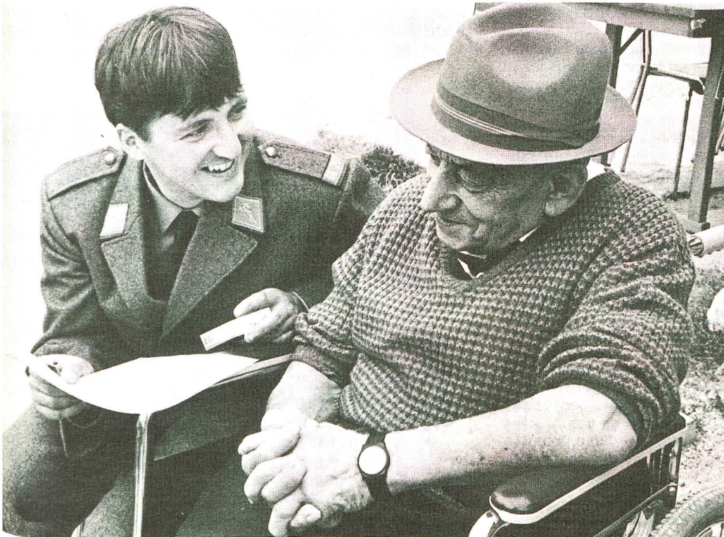
A ce vieux pâtre, qui peut encore chanter tout un répertoire des chansons populaires, la vie a appris une chose: on ne peut pas tout avoir en même temps.

Comme au loto de l'amitié, il me semble que de telles journées ne laissent aucun perdant. Il est difficile de dire, le soir venu, qui, des invités ou de ceux qui ont offert la richesse de leur cœur, ont été les plus satisfaits. □