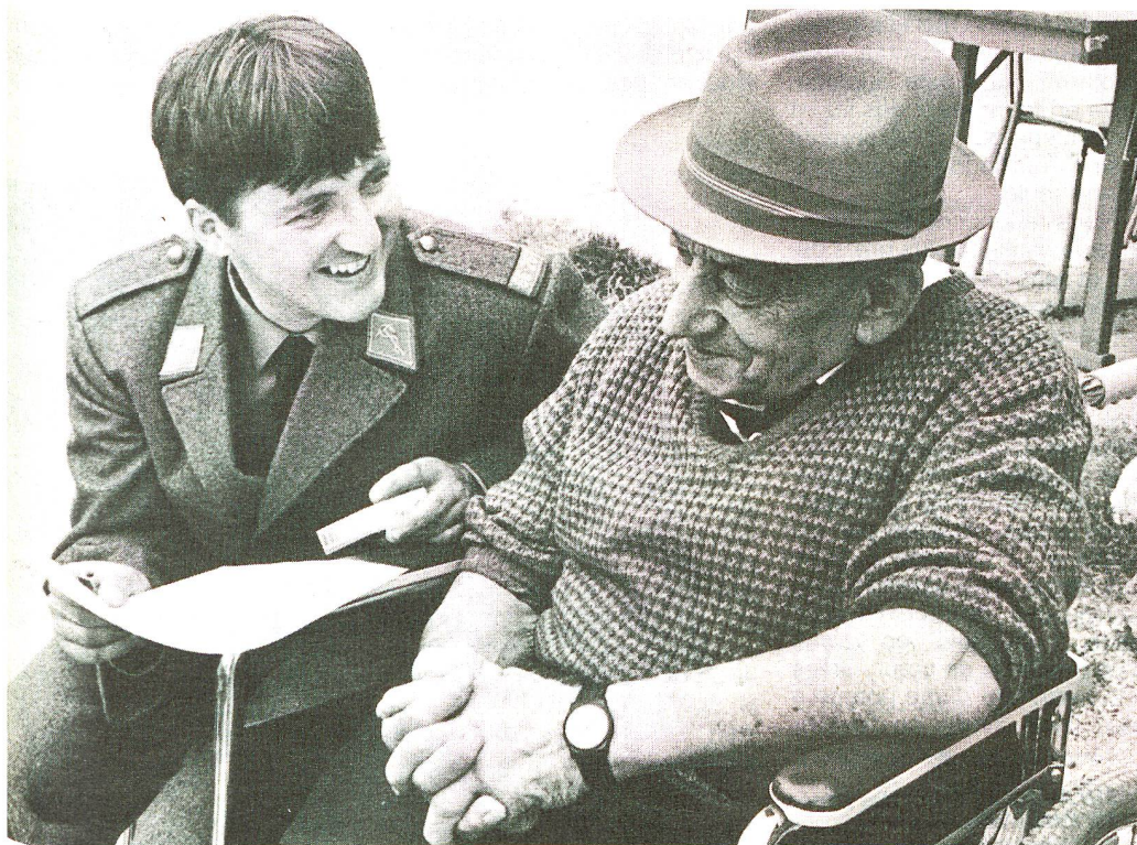
A ce vieux pâtre, qui peut encore chanter tout un répertoire des chansons populaires, la vie a appris une chose: on ne peut pas tout avoir en même temps.

Comme au loto de l'amitié, il me semble que de telles journées ne laissent aucun perdant. Il est difficile de dire, le soir venu, qui, des invités ou de ceux qui ont offert la richesse de leur cœur, ont été les plus satisfaits. □