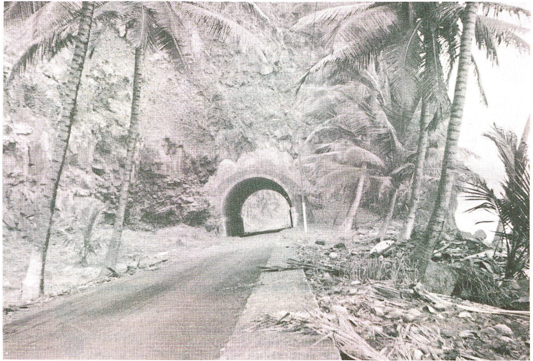
Vue de l'île. Les communications sont encore difficiles à l'intérieur de l'archipel, un handicap supplémentaire pour la jeune société Croix-Rouge.

Tout a débuté en 1976, lorsque la toute jeune république de São Tomé e Príncipe – l'indépendance de l'archipel avait été proclamée une année auparavant – crée par décret sa Société nationale Croix-Rouge. Une société qui s'empresse de se doter d'une structure nationale et locale. Pour une Croix-Rouge comme celle de