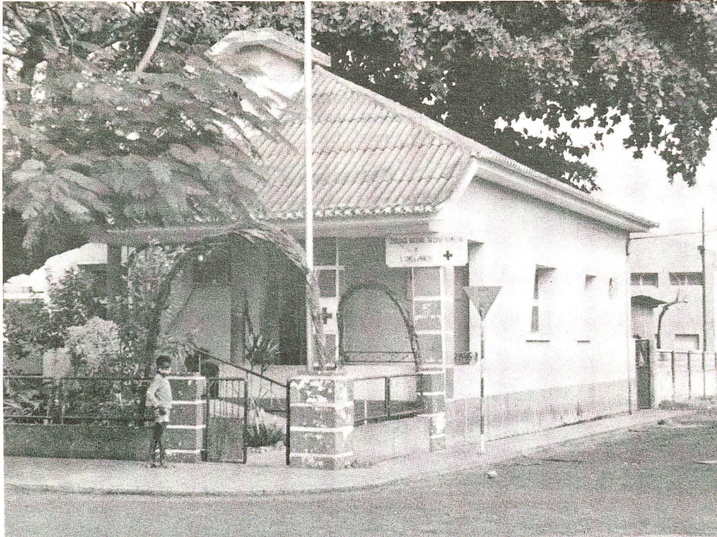
Le secrétariat central de la Croix-Rouge à São Tomé. Dès le départ, la société nationale s'est dotée d'une structure nationale et régionale.

pagnes de recherche de fonds. Il y a, dans ce dernier domaine, comme un air de ressemblance avec ce que l'on entend chez nous. Des projets qui seront en partie réalisés avec l'appui de la Ligue, mais qui font encore une fois appel à l'ingéniosité de la population locale. Dans le cadre de programmes d'occupation, on incite par exemple les personnes du troisième âge à confectionner des objets à partir de feuilles de palmiers, qui seront ensuite revendus sur le marché. Si après cela, certains affirment encore que le mouvement Croix-Rouge s'essouffle, je me demande ce qu'il leur faut!