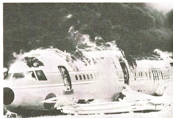
...à l'accident d'avion ou l'attentat.