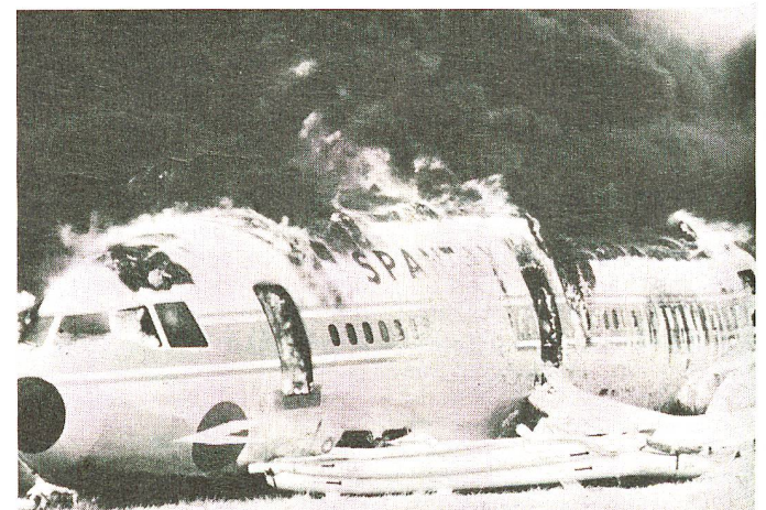
...à l'accident d'avion ou l'attentat.