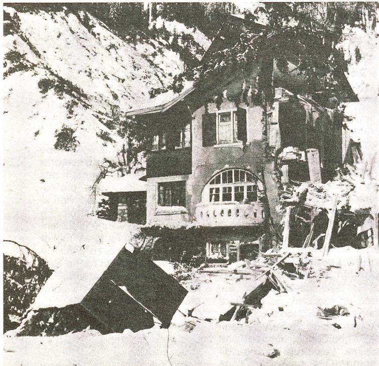
Les catastrophes quotidiennes: de l'avalanche...

Ces cours seront organisés par le secrétariat central de la CRS et non par les sections. Mais nous demanderons l'appui de ces dernières pour trouver des salles, des monitrices... mais c'est un programme de la centrale. □