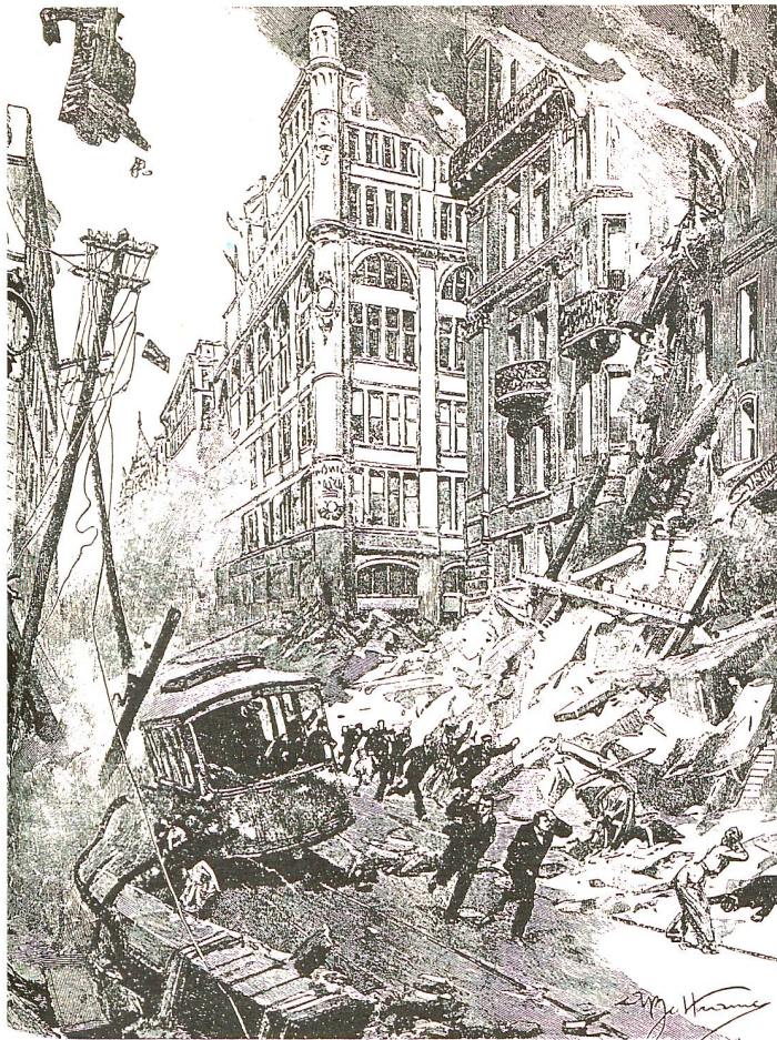
1906 San Francisco.

autres hôpitaux pourront-ils profiter de ce travail et en étendre la diffusion et la promotion.