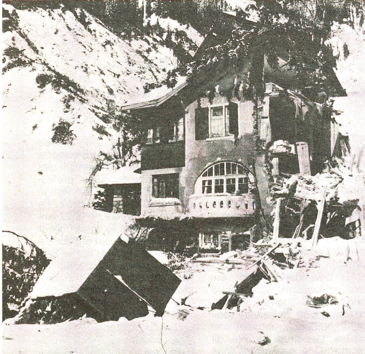
Les catastrophes quotidiennes: de l'avalanche...

sanitaire coordonné a besoin de volontaires, infirmières ou autres professions de la santé, qui se mettent à disposition en cas de catastrophe civile ou militaire et qui sachent agir et réagir juste et vite. Il faut sortir de ce faux raisonnement qui consiste à dire que le Service sanitaire coordonné est une organisation militaire. C'est faux. Il interviendrait aussi en cas de catastrophe civile. D'autre part, le SSC n'est pas une organisation en tant que telle. C'est une coordination des services sanitaires existant.