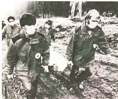
Dans des circonstances exceptionnelles, le savoir-faire est important.

1985 Mexico: les catastrophes, ça n'arrive pas qu'aux autres.