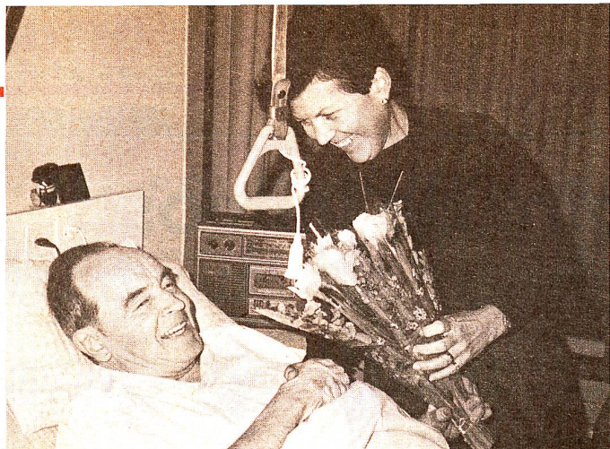
Les volontaires de la Croix-Rouge feront 20 000 heureux.