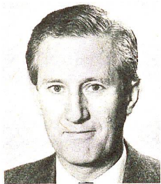
Ph. Grand d'Hauteville Genève Directeur de la section genevoise de la Croix-Rouge

ce thème, en répondant à la double question suivante: comment la Croix-Rouge peut-elle être, selon vous, une force de paix, et quelle peut être la contribution de la Croix-Rouge à la paix. Une occasion de découvrir la pensée de quelques-uns de ceux qui «font» la Croix-Rouge dans notre pays.