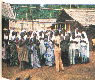
Le Club des mères de la Croix-Rouge locale a pour objectif d'améliorer les conditions d'hygiène et d'alimentation des enfants dans les régions occidentales du pays. Les hommes entraînant les règles doivent fournir pendant deux jours un travail au profit de la communauté.

Les différents projets mis au point entre les deux sociétés Croix-Rouge prouvent qu'il ne s'agissait pas seulement d'une simple réorganisation administrative «sur le tapis». Des projets ont déjà vu le jour, d'autres seront réalisés dans les mois ou les années à venir. Parmi les mesures prévues, on retiendra le soutien accordé à des initiatives locales en vue de l'amélioration des conditions d'hygiène en milieu rural et de la situation nutritionnelle ou bien encore l'assainissement de l'approvisionnement en eau potable, ainsi que la mise sur pied et la gestion de dispensaires. Toutes ces réalisations sont placées sous la surveillance de la Croix-Rouge ghanéenne et des délégués. Pour toutes ces opérations, la Croix-Rouge ghanéenne avait besoin d'un appui extérieur. La CRS lui a fourni cet appui, en utilisant l'argent restant de la collecte en faveur des rapatriés du Nigeria. La jeunesse du pays doit être associée au développement dans le cadre des projets de la Croix-Rouge ghanéenne. Des cours de formation et un camp de rencon-