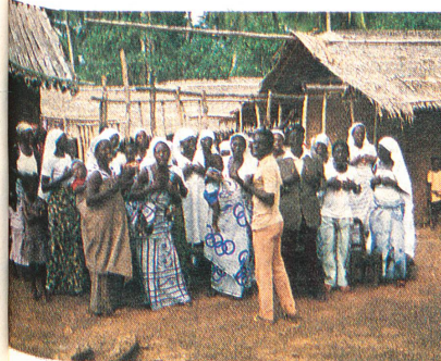
Le Club des mères de la Croix-Rouge locale a pour objectif d'améliorer les conditions d'hygiène et d'alimentation des enfants dans les régions occidentales du pays. Les hommes entraînant les règles doivent fournir pendant deux jours un travail au profit de la communauté.

Constatant la relation de confiance instaurée entre la CRS et la Croix-Rouge ghanéenne, la Ligue a chargé la CRS de coordonner l'action de la Croix-Rouge internationale au Ghana. Cette tâche est habituellement dévolue à la Ligue à Genève, comme c'est encore le cas pour les autres pays. Cette nouvelle forme de collaboration donne entièrement satisfaction à la CRS. Les projets concrets qui en résultent constituent un enrichissement aussi bien pour la Ligue que pour la société Croix-Rouge bénéficiaire ou pour la CRS elle-même. La tâche de la Croix-Rouge suisse, ces prochains mois et prochaines années, en exécution du mandat qui lui a été confié, consistera à encourager les autres sociétés Croix-Rouge nationales à s'engager dans cette coopération inter-