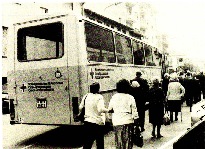
Chiasso, 30 agosto 1984: la sezione del Mendrisiotto della Croce Rossa Svizzera organizza una gita a Pomia (Piemonte) per gli anziani della casa di riposo chiassese.

L'Almanacco è venduto al prezzo di fr. 6.20 e il ricavato viene utilizzato dalla Croce Rossa Svizzera per assolvere i suoi compiti assistenziali su piano nazionale. □