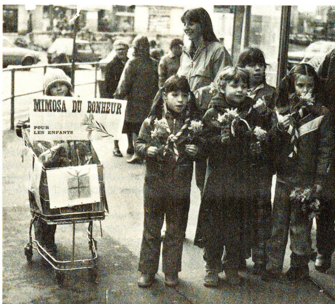
Depuis plus de trente ans, le Mimosa du Bonheur pour l'aide à l'enfance défavorisée.

Situons pour mémoire la fabrication de couvertures pour