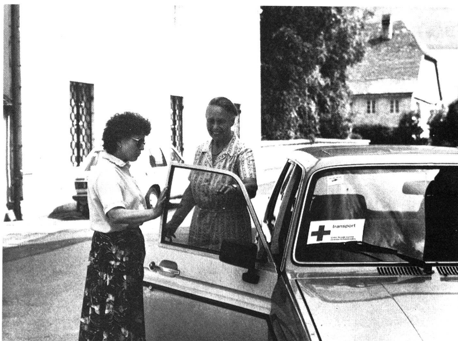
Une assistante bénévole s'apprête à conduire une patiente chez le médecin. On peut voir le panneau Croix-Rouge à l'avant de la voiture; ce panneau est remis à l'assistant bénévole lors de son premier transport.