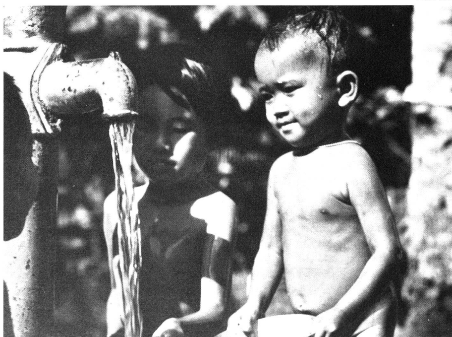
Suffisamment d'eau saine, de bons égouts, permettent d'éviter de nombreuses maladies.