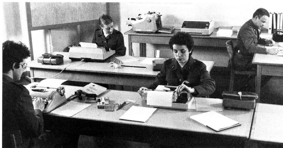
SCF au service administratif.

Organisation militaire de la Confédération suisse, article 20, 3 e et 4 e alinéas (RS 510.10); ordonnance du 9 novembre 1977 concernant le service complémentaire féminin (RS 513.411).