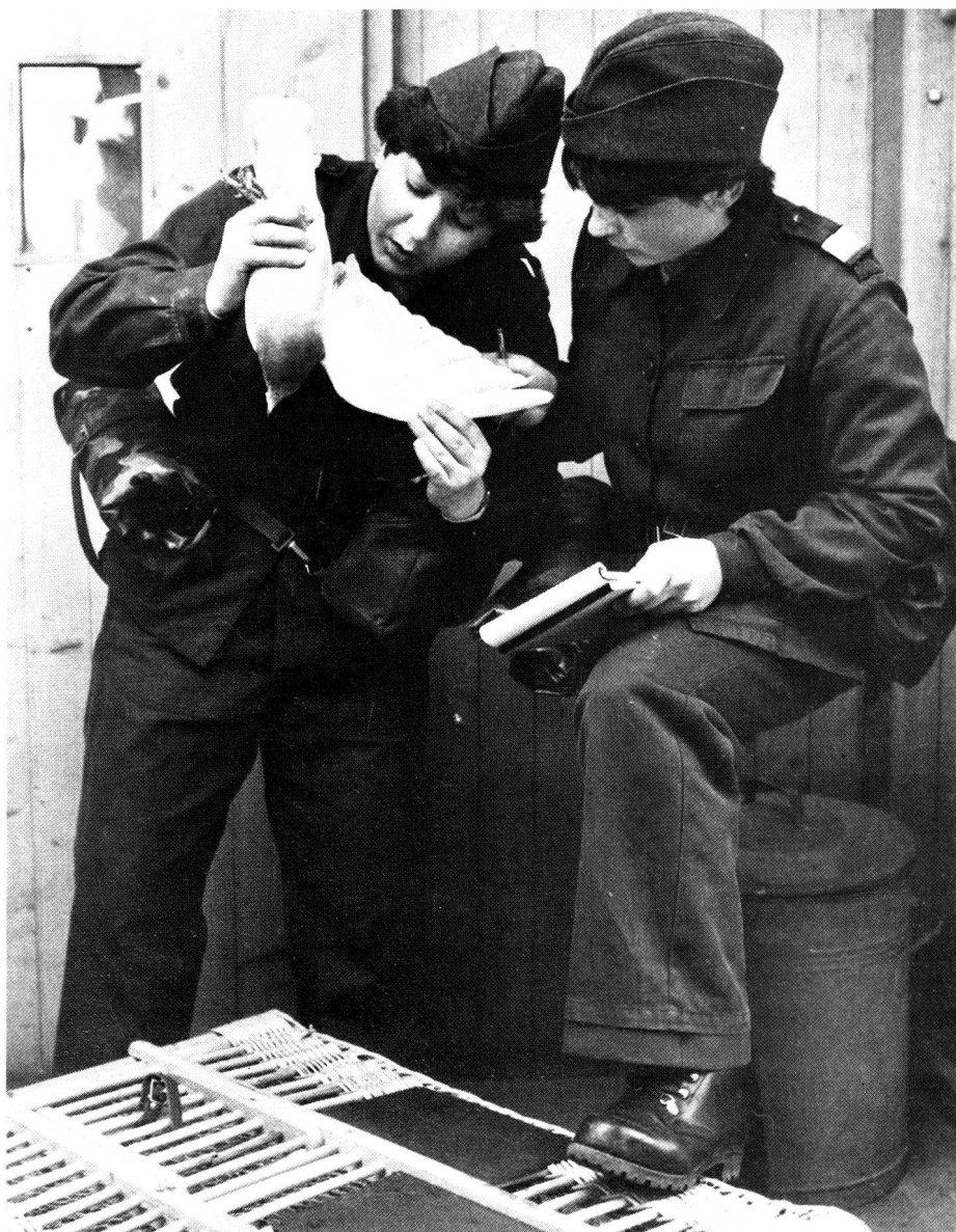
SCF au service des pigeons voyageurs.