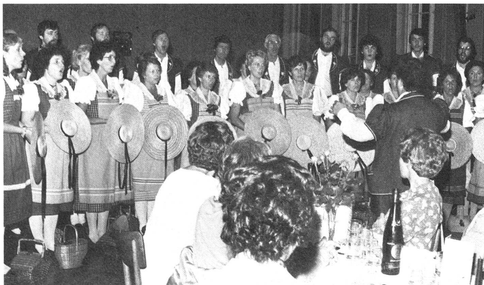
La chorale fribourgeoise exécutant quelques chants.