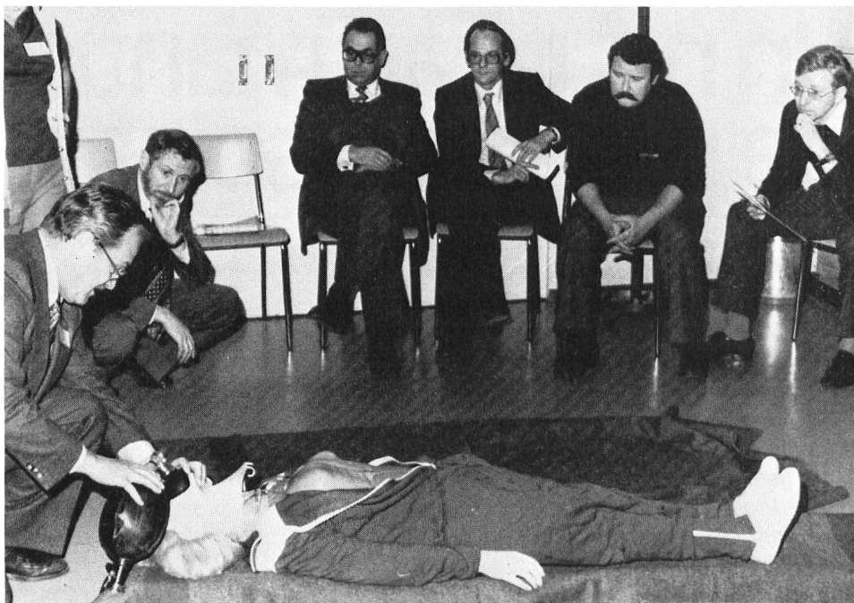
Formation de médecins instructeurs

- Nos cours de deux jours ont permis d'enseigner à des médecins d'urgence les mesures médicales spécifiques de premiers secours: intubation, respiration au moyen d'appareils, massage