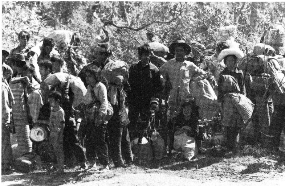
Réfugiés cambodgiens à l'entrée du camp de Nong Samet. Dans un état souvent lamentable, ils attendent d'être accueillis dans le camp où ils pourront être restaurés et soignés.

Les réfugiés khmer libres: Le camp de Khao-I-Dang a été créé à leur intention, mais ils n'étaient que 80 000 à la mi-décembre. Les deux autres camps sont: Nong Samet, avec plus de 200 000 personnes environ, et Mak Mun avec plus de 250 000 personnes, situés tous les deux près de la frontière. Ces deux grands groupes de fuyitifs sont sous le commandement militaire des Khmer Serei (Khmers libres, mouvement anticommuniste).