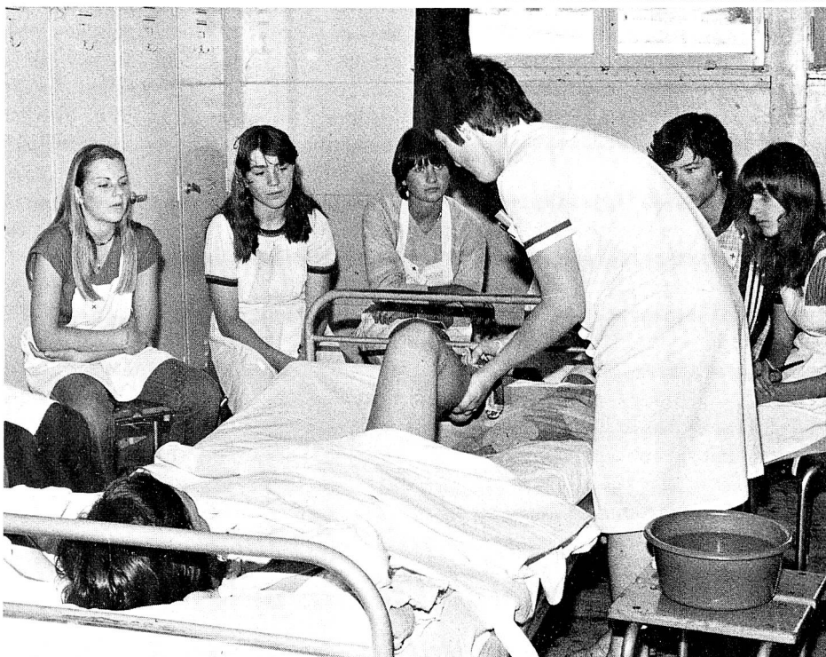
Les jeunes apprennent comment procéder concrètement à certains soins.