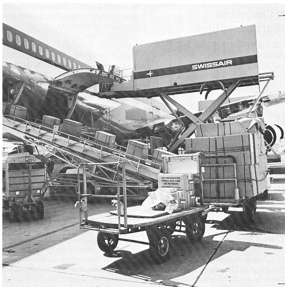
Les surplus d'érythrocytes sont envoyés par avion en paquets frigorifiques en Grèce, au Portugal et partout où les demandes en globules rouges sont grandes. Les globules rouges servent, entre autres, au traitement de l'anémie méditerranéenne.