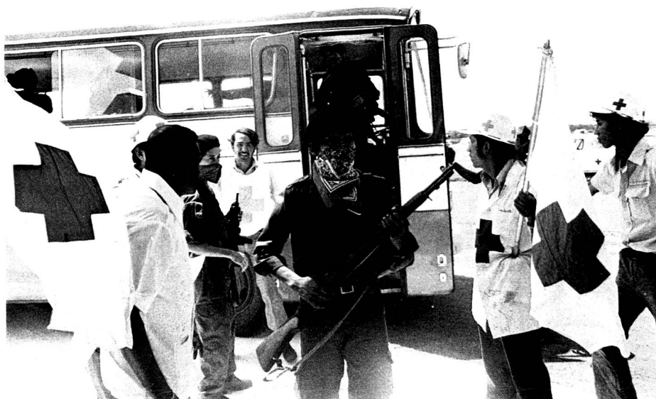
Application pratique des Conventions de Genève: en septembre 1978, lors du siège du Palais National de Managua, qui dura près de 48 heures, les «guérilleros» furent amenés sous escorte de la CR du Nicaragua, à l'aéroport de Managua, avant de prendre l'avion à destination du Panama.