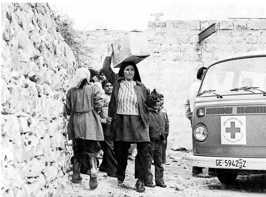
Aide aux réfugiés palestiniens dans les camps de la région de Tyr.