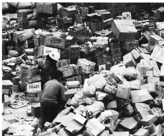
La Croix-Rouge suisse gère un grand entrepôt de matériel de secours destiné aux interventions en cas de catastrophes, qui appartient à la Confédération.

Il arrive malheureusement encore et toujours que des œuvres d'entraide ou des gouvernements envoient dans une région de catastrophe du matériel de secours non demandé ou inutilisable, ou que ce dernier soit si mal emballé qu'il ne peut plus être distribué. C'est ainsi que naissent des situations déplaisantes: des montagnes de sacs, de cartons et de caisses, entassés en désordre dans des aéroports surchargés. Personne ne sait ce qu'ils contiennent, ce qu'il faut en faire. De tels envois prennent de la place et entraînent du travail superflu et, bien sûr, un énorme gaspillage d'argent. Mais même des envois dûment emballés et étiquetés représentent une charge lorsqu'ils ne correspondent pas aux besoins. Il est donc extrêmement important de s'en tenir à une discipline stricte et de ne pas expédier – peut-être sous la pression de l'opinion publique – n'importe quelles marchandises, avant d'avoir fait le point sur les besoins réels d'une région ou d'une population touchées. Il est en outre primordial d'informer l'organisme de coordination de la nature de l'aide apportée, des délais d'expédition du matériel de secours et de la durée de leur transport.